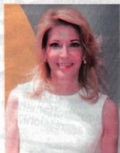
Candace Bushnell, giornalista e autrice di Sex and the City .

Fa sognare «Ritrae le donne come vorrebbero essere» dice Anna Pettinelli, voce di Rds, che nel 2000 ha condotto su Telemontecarlo il talk show Sesso, parlano le donne , cornice alla prima stagione del telefilm. «Le protagoniste sono belle e spregiudicate. Fanno lavori che le realizzano e indossano abiti favolosi o sandali da mille e una notte».