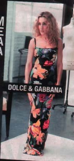
DOLCE & GABBANA